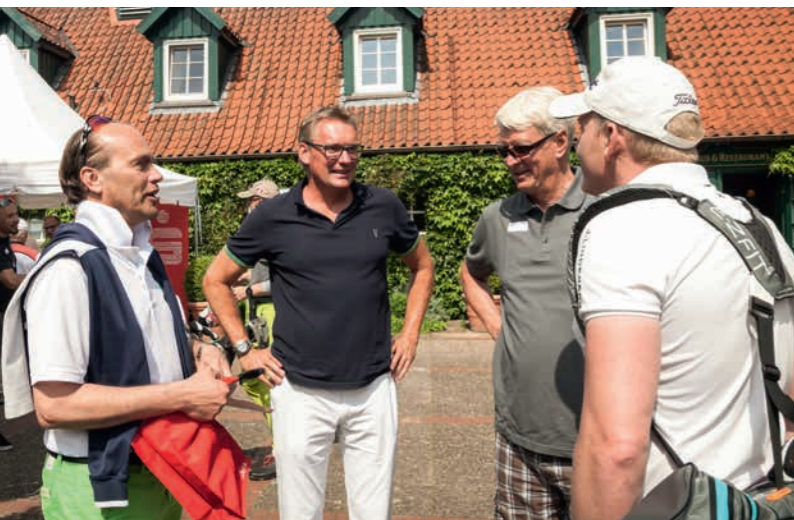
Netzwerken beim Jahresauftakt der Sparkasse Lüneburg.