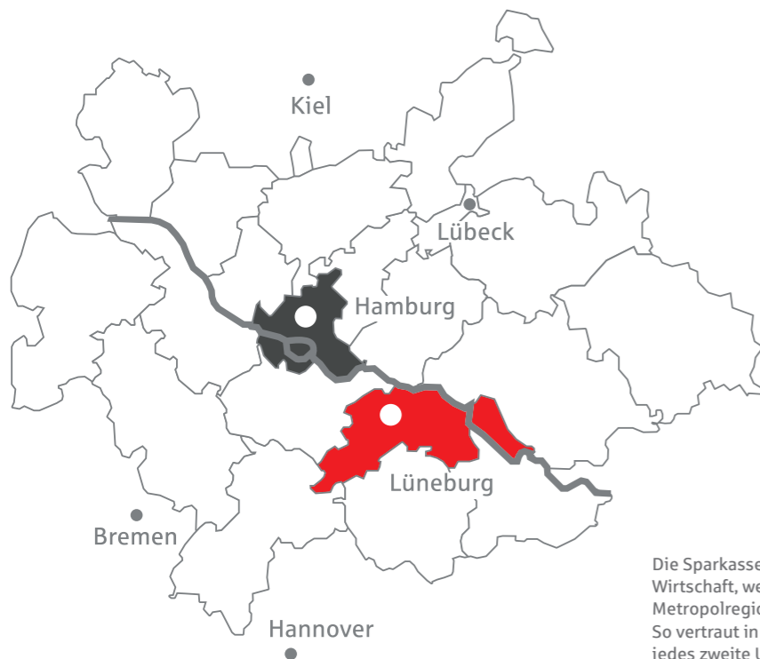
Die Sparkasse Lüneburg vernetzt die regionale Wirtschaft, weil sie mit ihren Kunden in der Metropolregion Hamburg an einem Strang zieht. So vertraut in und um Lüneburg bereits mehr als jedes zweite Unternehmen auf sie als Hausbank.

Durch die Nähe zu unseren Kunden können wir deren Bedürfnisse frühzeitig erkennen und optimal erfüllen. Schnell, flexibel und lösungsorientiert. Mit rund 42 Prozent sind die Sparkassen heute der größte Kreditgeber an Unternehmen und Selbstständige, die meisten